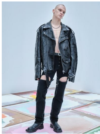
JOHN LAWRENCE SULLIVAN