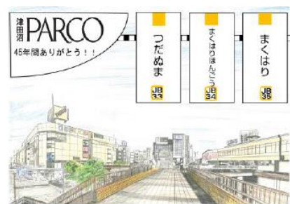
スタンプ台紙 (イメージ)

完成したスタンプ台紙を JR 津田沼駅改札で駅係員に提示すると、プレゼントがもらえます。