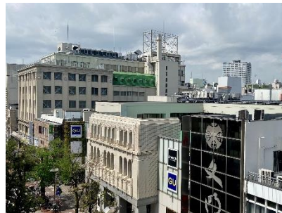
2023 年 カトレヤプラザ伊勢佐木 (近いアングルで撮影してみましたが、こちらの展示はございません)

エアリズムの店頭 POP を近隣企業様とコラボ着用シーンや着用感に加え協業企業様の情報を店頭でご紹介