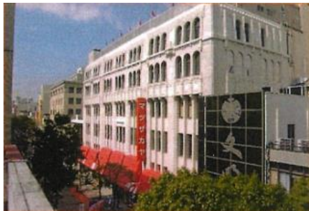
2005 年 横浜松坂屋