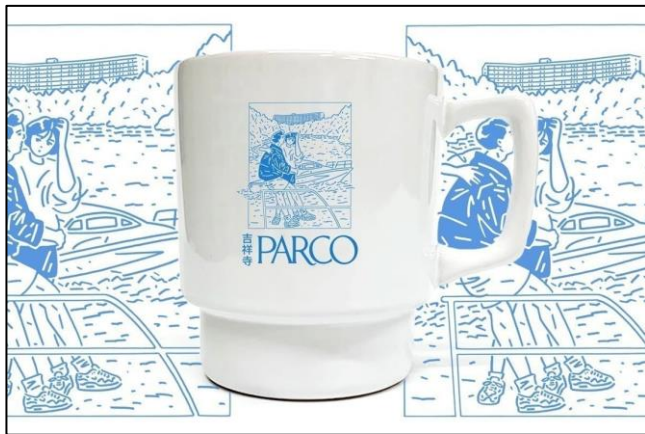
▲深川優×吉祥寺PARCO コラボマグ 販売価格：3,500円（税込・送料込み）