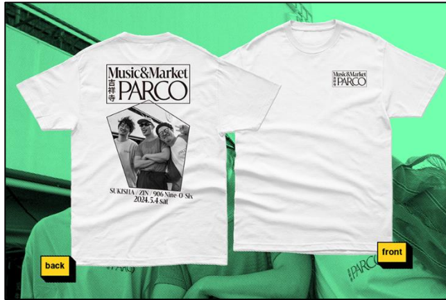
▲SUKISHA×906-Nine-O-Six×ZIN フォトT 販売価格：6,000円（税込・送料込み）