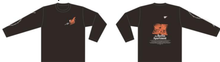
Long Sleeve T-shirt 各7,150円