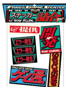
Sticker Pack 1,500円