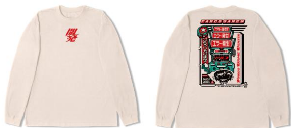
Long Sleeve T-shirt 7,700円