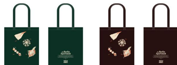
Tote Bag 各2,750円

詳細・最新情報は特設サイトから： https://games.parco.jp/page/pgc