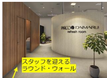
スタッフを迎える ラウンド・ウォール

名称：PARCO・大丸 リフレッシュルーム 開設：2026年4月1日 場所：心齋橋PARCO 8F 面積：60坪 席数：52席 設計：コクヨ株式会社