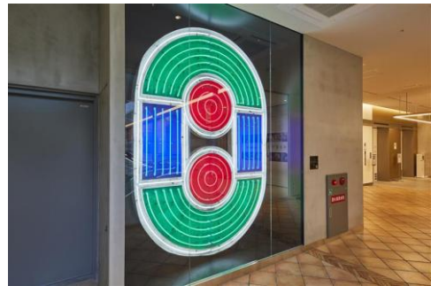
ネオンサイン O (13F 常設展示)