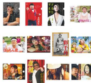
クリアファイル 各種 各¥500