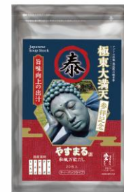
極東大満天×やすまる 和風万能だし ¥1,000