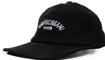
YOKO FUCHIGAMI ソフトバイザーキャップ ¥4,400