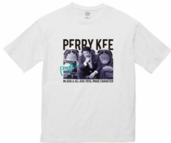
ペリー・キービッグシルエットTシャツ (BLACK/WHITE) 各¥5,800