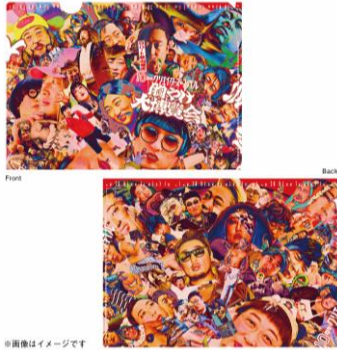
クリアファイル 胸やけ大博覧会 ¥500