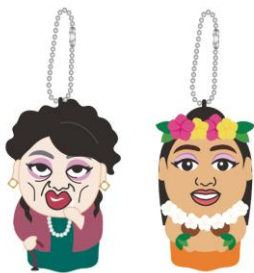
マスコット (矢崎すず子/杉尾モナハ美也子) 各¥2,500