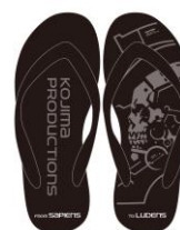
KOJIMA PRODUCTIONS ビーチサンダル 5,500円 (7月発売予定)