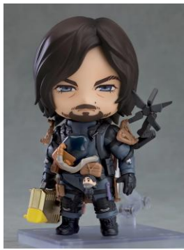
ねんどろいど DEATH STRANDING 2 サム 6,600円