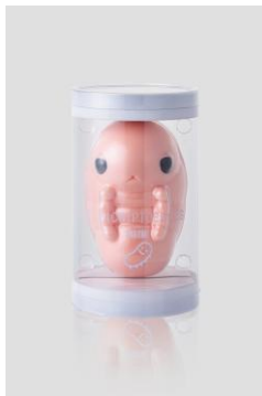
PUNIKリプトビオシス スクイーズフィギュア 2,420円