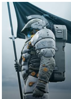
KOJIMA PRODUCTIONSの シンボル「LUDENS」

株式会社コジマプロダクションは、ゲームクリエイター小島秀夫が"FROM SAPIENS TO LUDENS"の旗のもと、2015年12月に設立したクリエイティブスタジオです。