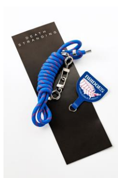
DEATH STRANDING ストランド ショルダーストラップ 1,980円

『DEATH STRANDING 2: ON THE BEACH』の新作グッズやKOJIMA PRODUCTIONSのマスコットであるLUDENSの新作グッズなど、多数の人気アイテムを販売いたします。