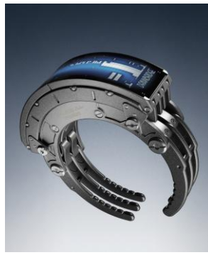
Anicorn DEATH STRANDING 2 リングターミナル 39,600円