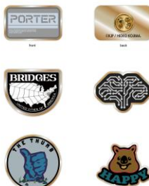
DEATH STRANDING 2 トレーディングピンバッジ vol.2 (全5種・ランダム) 770円