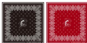
KOJIMA PRODUCTIONS ロゴバンダナ (全2種) 各2,200円