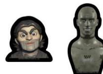
ドールマン レンチキュラーステッカー/マグネット チャーリー レンチキュラーステッカー/マグネット 各770円