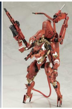
プラキット GHOST MECH COFFINS COMMANDER 9,900円

※一部アイテムにつきましては、6月6日のストアオープン以降、順次販売開始予定となります。 ※画像はイメージです。 ※価格は全て税込表記です。