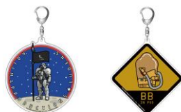
DEATH STRANDING 2 アクリルキーホルダー (全2種) 各770円