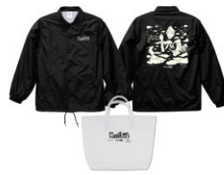
TAPPEIコラボ キービジュアル コーチジャケット (ビニールバッグ付き)