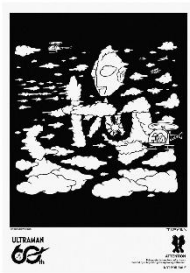
TAPPEI 直筆サイン入り 本キャンペーン ビジュアルポスター