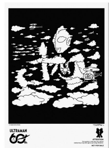
ビジュアルポスターイメージ ポスターサイズ：A2縦(W420mm×H594mm)