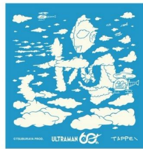
ステッカーサイズ：W48mm×H50mm

※キャンペーンビジュアルステッカーは1回の引換につき、最大3枚までのお渡しとなります。