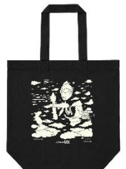
TAPPEIコラボ キービジュアル トートバッグ

※画像はイメージです。 ※掲載している景品は一部となります。 ※景品には限りがございます。 ※企画内容は予告なく変更となる場合がございます。