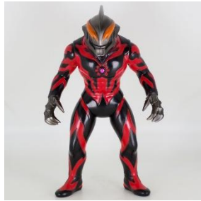
ブルマック ウルトラマンベリアル (TSUBURAYA限定カラー)Ver.2