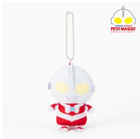
選べるぶちマスコット