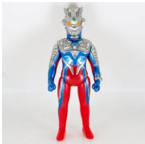
ブルマック ゼロ&ベリアルセット