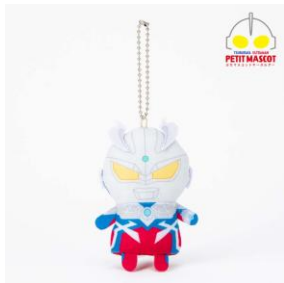
ぶちマスコットキーホルダー ウルトラマンゼロ