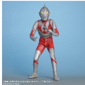
大怪獣シリーズ ウルトラマン(Aタイプ) ツブラヤストア限定版