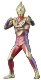
大怪獣シリーズ ULTRA NEW GENERATION グリッターティガ スペシャルエディション