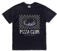
【magmaコラボ】Tシャツ - MIDNIGHT PASTA CLUB - Monochrome *新色 [S/M/L/XL]