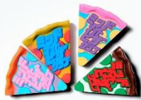
【magmaコラボ】マグネット - ミッドナイトピザクラブ - (40個限定)