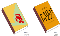
MPCマッチ(2種セット) - TRAVEL & BOOK -