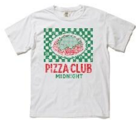
【magmaコラボ】Tシャツ - MIDNIGHT PASTA CLUB - White [S/M/L/XL]