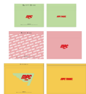
MPC TRAVEL Pake (3種セット)