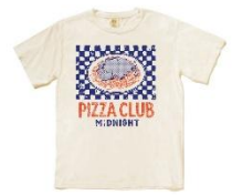
【magmaコラボ】Tシャツ - MIDNIGHT PASTA CLUB - Ivory [S/M/L/XL]