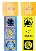
【magmaコラボ】 ステッカーセット - キラ旅 / ネオン山 -