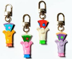
【magmaコラボ】キーリング - ピザマン - (170個限定/すべて1点もの)