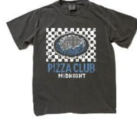
【magmaコラボ】Tシャツ - MIDNIGHT PASTA CLUB - Black [S/M/L/XL]