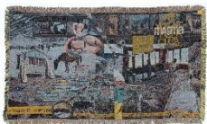
【magmaコラボ】 ジャガードブランケット - MIDNIGHT OYASUMI CLUB -