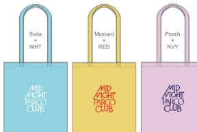
MPPCトート Soda / Lemon / Peach