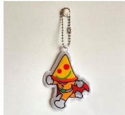
【magmaコラボ】 リフレクターキーホルダー - FLASH PIZZA MAN -