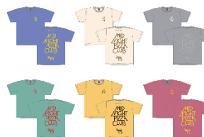
MPC ロゴTシャツ (全11色) *新色あり