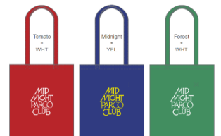
MPPCトート Tomato / Midnigt / Forest