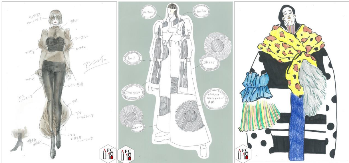
<左> 細井玲寧 (ホソイ レネ) / 京丹波町立瑞穂中学校 / 『なれない人 (アンニュイ)』 <中央> 市野りお (イチノ リオ) / 愛知県立名古屋西高等学校 / 『turn beautiful colors』 <右> 黒田杏実 (クロダ アミ) / 北海道芸術高等学校 / 『tacky fashion』