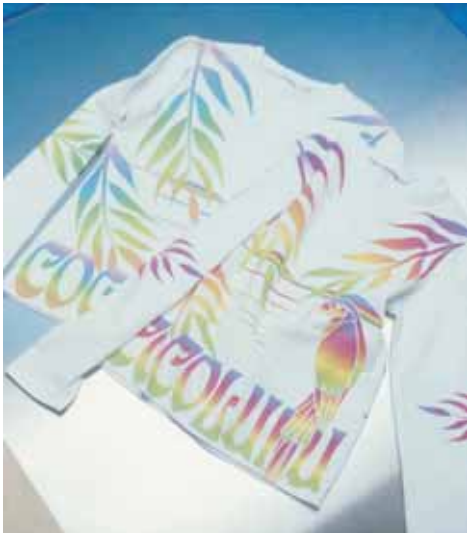
COCOLULU SQUARE ココルルスクエア

【3F・ドメスティックキャラクター & デニムスタイル】ティーンを対象とした「キャラクターカジュアル」「ドメスティックデニム」「スポーツ」ファッションを提案