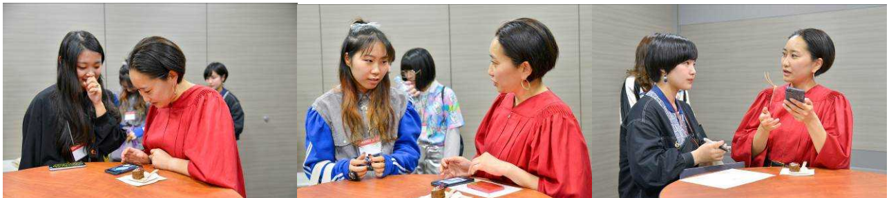
—選出者が審査員からフィードバックを受ける様子—