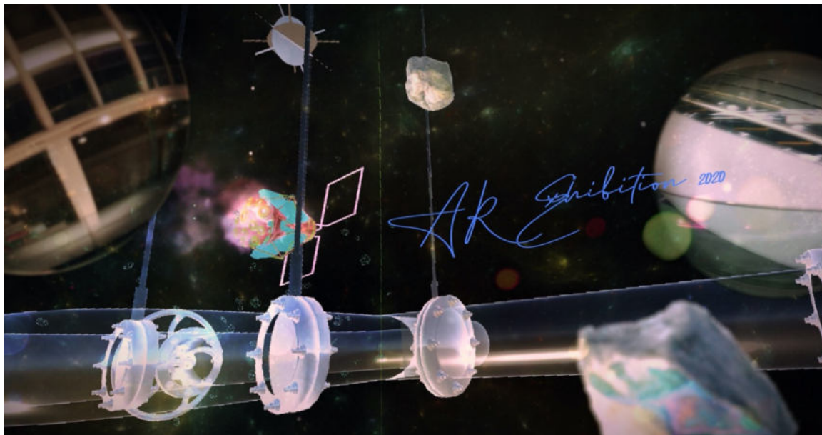
(画像)5F XRSHOWCASE 展示作品イメージ

株式会社パルコ（本部：東京都渋谷区、代表取締役兼社長執行役員：牧山浩三、以下パルコ）は、2019年11月に開業した渋谷 PARCO の1周年イベントの一環として、xR を活用したデジタルアートの祭典「SHIBUYA XR SHOWCASE ART MONTH」を開催いたします。